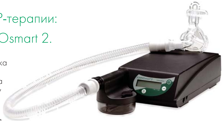
SOMNOsmart 2 с увлажнителем SOMNOclick

средний уровень шума: ок. 28 дБ (А) при 10 см Н 2 O, • вес: 3,6 кг, диапазон лечебного давления АРАР: от 4 до 18 гПа, • точность поддержания терапевтического давления: ± 0,4 гПа система фильтров: фильтры грубой и тонкой очистки, • габариты: 18x9x32 см